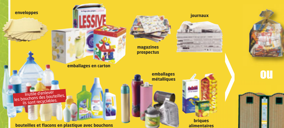
bouteilles et flacons en plastique avec bouchons

papiers - cartons - bouteilles en plastique emballages métalliques - briques alimentaires