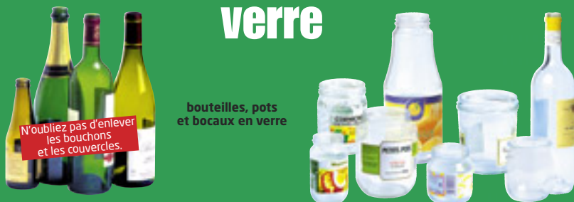
bouteilles, pots et bocaux en verre